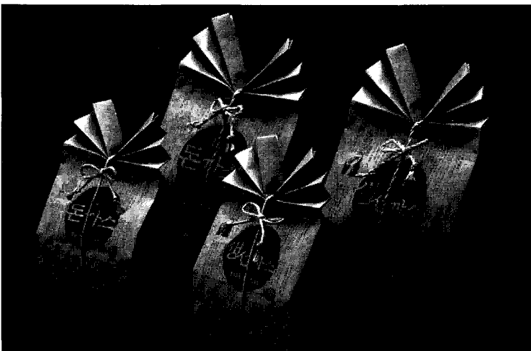
「큰길 돈까스, 생선까스」 - 큰길식품(주) -

녹차성분을 함유한 내용물에 치아 모양의 형상화로 세련됨과 안정감을 주었으며 소비자로 하여금 친숙한 이미지를 전달하도록 하였다. 또한 제품의 고급감과 세련된 효과를 동시에 주었고 보는 시야에 따라 COLOR의 변화가 있게 하였다.