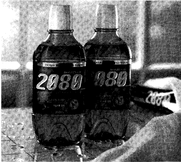
「덴탈 크리닉 2080」 - (주)애경산업 -

녹차성분을 함유한 내용물에 치아 모양의 형상화로 세련됨과 안정감을 주었으며 소비자로 하여금 친숙한 이미지를 전달하도록 하였다. 또한 제품의 고급감과 세련된 효과를 동시에 주었고 보는 시야에 따라 COLOR의 변화가 있게 하였다.