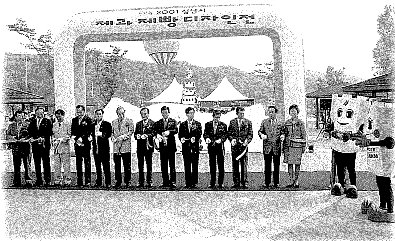
▲ 이번 행사를 마련한 베이커리업계 및 성남시 관계인사의 개회식을 알리는 테이프 커팅식 장면.

또한 역사관 앞쪽으로 파리크라상에서 협찬한 초대형 10단 케이크가 전시돼 지켜보는 사람들의 탄성을 자아냈