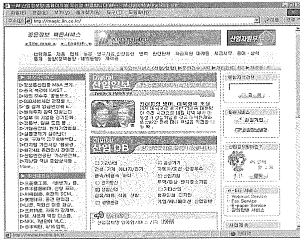
(그림 : 인터넷 산업정보망 홈페이지 첫 화면)