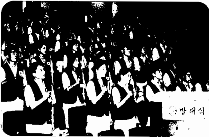
2001 대학생 해외봉사활동 발대식 및 봉사 활동 워크숍