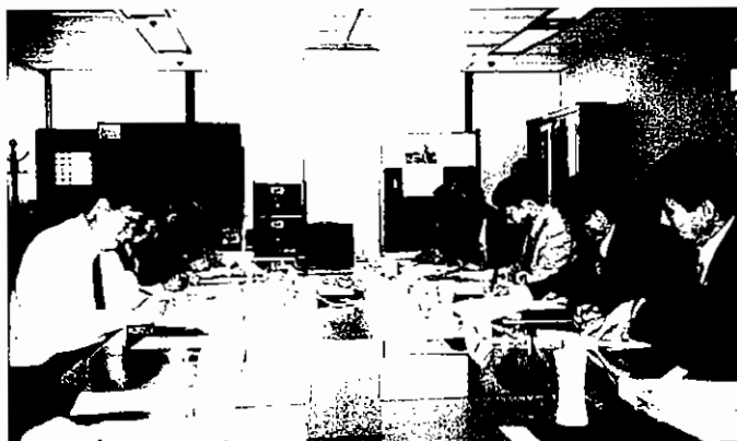
제2주기 대학 종합평가 편람에 관한 자문회의

대교협은 전국 193개 회원대학 총장님들을 모시고 한국 대학교육의 나아갈 방향을 제시하고, 대학 사회가 안고 있는 현안문제의 해결 방안을 심도 있게 논의함과 동시에 대학 상호간 협조와 유대체제를 강화하기 위하여 "국가 인적자원 개발을 위한 정부·기업·대학의 역할"이란 주제로 '2001년 하계 대학총장 세미나'를 6월 28일부터 30일까지 3일간 제주 롯데호텔 대회의장에서 개최하였다. 이번 2001년 하계 대학총장 세미나에서는 국가 인적자원을 효율적으로 발굴·육성·개발해야 하는 대학의 시대적 역할에 대하여 전국 회원대학 총장님들의 다양하고 심도 있는 논의가 이루어졌다.