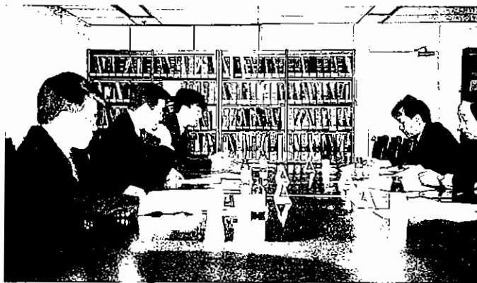
대학입학정보박람회 기획·운영 준비위원회