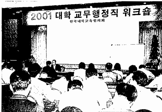
대학 교직원 연수 사업