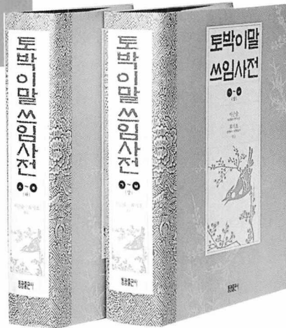
이근술·최기호 엮음 동광출판사/A4/1,100면 내외/180,000원(합본)

사전을 펼쳐보자. '매지매지'라는 말은 '좀 작은 물건을 여럿으로 따로따로 나누는 모양'을 가리키는 말이다. 그러나 좀처럼 그 뜻이 와닿지 않는다. 이 항목에는 심상대와 전상국의 소설 문장이 예문으로 올라와 있다. '구름덩이가