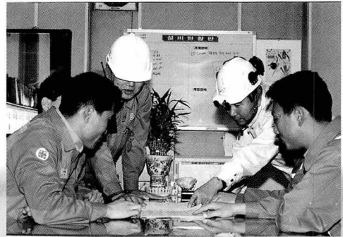
▲ 현장에서의 안전회의

중기계획으로 추진하고 있는 안전통합시스템 구축은 미래의 POSCO의 안전현황을 기대하기에 충분하다.