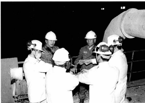
▲ 작업전 유해위험예지훈련