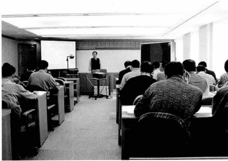
▲ STOP 교육

할 직책보임자에서 일반직원에 이르기까지 전문 교육과정을 개설하여 실시함으로써 안전의식을 고취시키는데 중점을 두고 있으며, 사외적으로는 교육 희망자를 접수받아 현재 7개 과정에 대해 교육을 추진하고 있다.