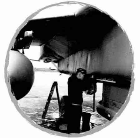
CFT를 떼어낸 후 정비하는 모습

몸체 옆에 부착되는 보조 연료탱크 CFT. 기존 F- 15D와 외양으로 구분되는 가장 큰 특징이다. F-15E의 최대 연료적재량 은 34,420lb(15,613kg)에 달한다.