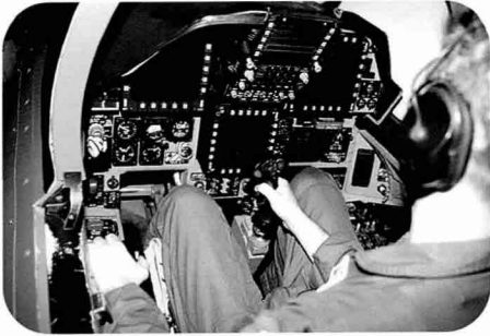
MFD 디스플레이 화면을 제공하는 Simulator