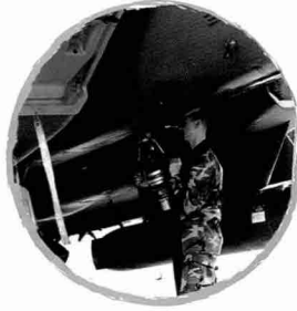
유조차에서 연료를 공급하는 모습