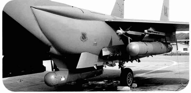
우람한 모습의 F-15E. 아래에 전방감시적외선장비(FIIR)가 보인다.