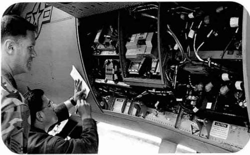
비행훈련후 비행기록을 점검하는 조종사와 정비사