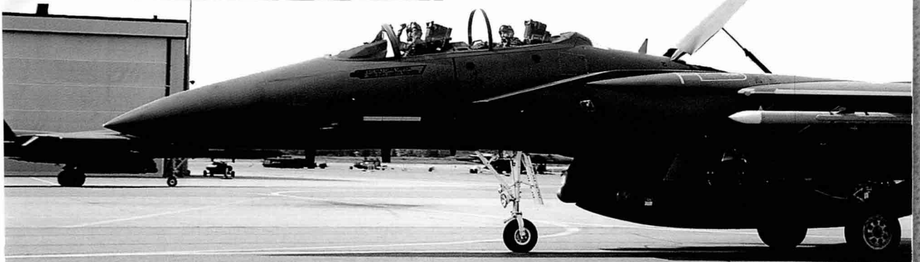
이륙을 위해 활주로로 이동하는 F-15E

훈련을 마친 후 후속정비를 위해 활주로 옆 정비공간으 로 진입하는 F-15E, 훈련 후 고장이 아닌 상태에서 다 음 비행을 위한 연료, 무기, 탄약, 전자전 장비, 채프, 플레어 교체에 약 45분이 소요된다고 한다.