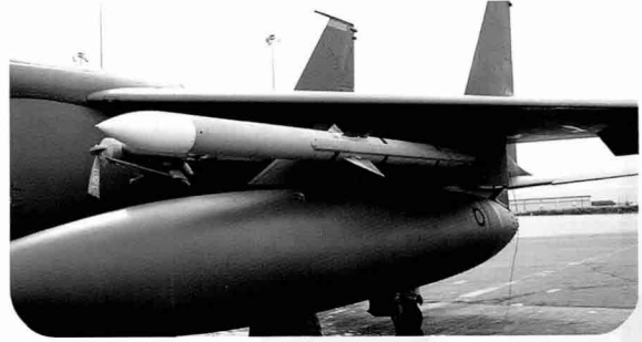
AIM-120 AMRAAM. 액티브 레이더와 관성 유도장치로 미사일이 목표물을 스스로 추적하므로 조종사는 여러 목표에 각각의 미사일을 조준, 발사할 수 있다. 속도는 마하4, 사정거리는 50km이다.