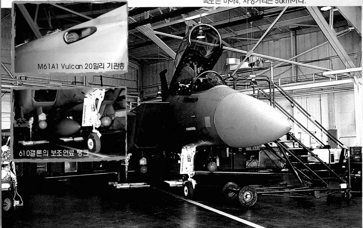
M61A1 Vulcan 20밀리 기관총