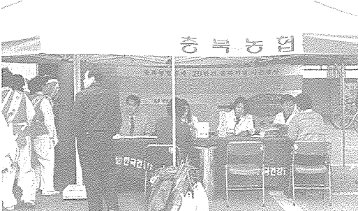
▲ 충북지부는 농협 금요장터, 청주시 해화학교, 참예수교회, 주성대 체육회관에서 지역주민, 노인 등 120여명에게 건강검진 및 건강상담을 실시했다.