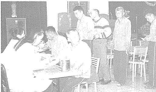
▲ 대전·충남지부는 대전 심경장원 수용자와 의보가입자, 보건기여 대상자 등 주민 1,100여명과 천안신계초등학교 외 9개교의 중식지원학생 300여명에게 혈액질환 검사 등을 무료로 실시했다.