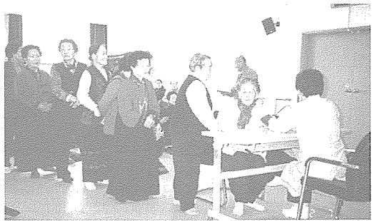
▲ 울산지부는 공개강좌 참여 지역주민 80여명에게 무료 건강검진 및 건강상담을 실시했다.