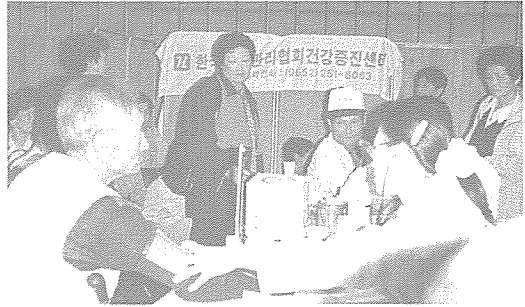
▲ 전북지부는 산간 오지 지역주민(무주군 설천면, 순창군 동계면)을 210여명을 대상으로 당뇨 및 심장질환 검사를 무료로 실시하고 열린강좌 참여 주민 중 희망하는 주민 10여명에게 혈액질환검사 등 무료 건강검진을 실시했다.