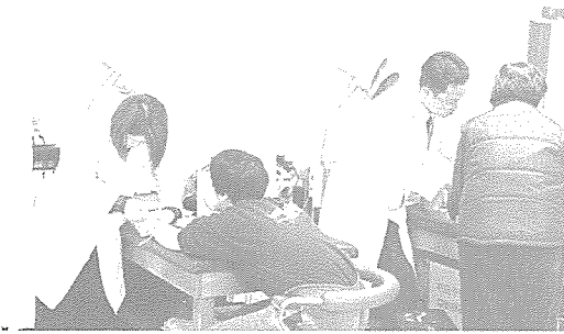
▲ 강원도지부는 교육청과 시 사회복지과의 협조를 얻어 생활보호 대상 학생 100여명에게 무료 건강검진과 건강상담을 그리고 노인복지회관 노인회원 50여명에게는 무료 독감 예방접종을 실시했다.