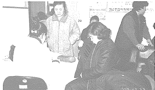
▲ 경남지부는 지난해 12월 경남 종합사회복지관에서 저소득층 주민 100여명을 대상으로 위장조영 촬영 외 7종목을 무료 건강검진을 실시했다.