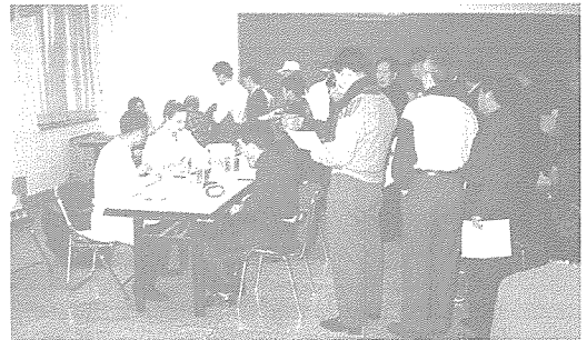
▲ 서울지부는 구청 사회복지과의 협조를 얻어 노숙자 시설인 자유의 집과 강서구 생활보호대상자, 장애인 시설인 늘푸른 복지관 등을 방문하여 원생 및 이혼인 1,500여명에게 무료 건강 상담 및 건강 검진을 실시했다.

한국건강관리협회는 지난해 12월 한달 동안 각 시도 사회복지과 등의 협조를 얻어 노숙자의 집, 복지관, 요양원 등을 방문하여 20,000여명에게 건강상담과 건강검진을 실시했습니다.