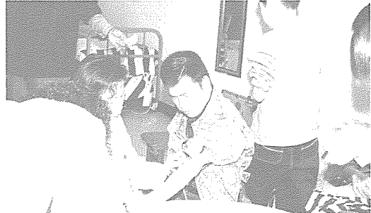
▲ 광주·전남지부는 소년소녀 가장 및 생활보호대상자 자녀 3200여명과 양로시설인 천혜경로원 50여명, 육아 시설인 성빈녀사를 방문하여 심전도, X선 등 무료 건강검진을 실시했다.