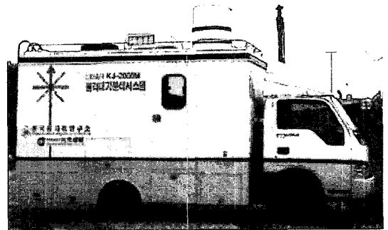
그림 2 대기오염분석용 이동형 LIDAR 시스템

최근 한국원자력연구소에서는 대류권에 존재하는 여러 가지 오염기체중에서 SO_2 , NO_2 , O_3 , 분진 등의 대기오염물질을 원격으로 측정할 수 있는 이동형 LIDAR 시스템이 개발되었다. 이 장치는 측정거리는 약 3~5 km이며, 측정시간은 10분 이내이며 검지범위는 ppb(part per billion)에서 수%에 달한다.