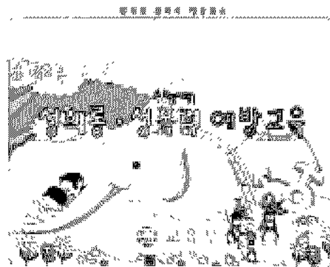
<Figure 2> Introduction

메인 화면은 유아의 생활주변에서 볼 수 있는 우리 집, 유치원, 가게, 놀이터, 길가가 표시된 화면이 뜨고 각 장소에 마우스를 가져가면 그 장소에서 발생할 수 있는 성희롱/성폭력 상황이 나타난다.