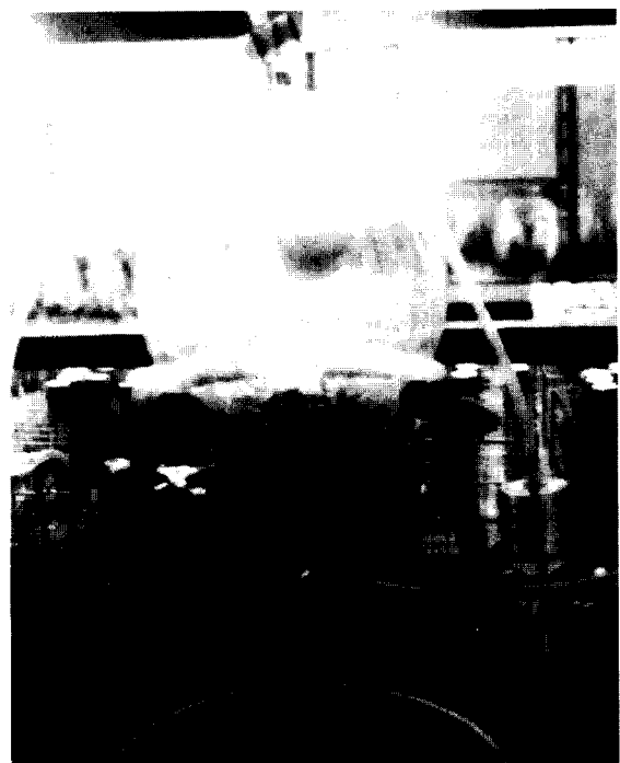
Figure 1. Bulblet clusters growing in a ebb & flood type bioreactor.

저반부가 비대된 자구를 형성하기 위하여 인편을 8주간 액체배양한 결과, 저반부 발육이 빈약하여 저반부가 비대된 자구는 전혀 형성되지 않았으며 인편엽이 무성하게 자라 인편엽의 길이가 매우 길었다. 이러한 현상은 저반부가 비대된 자구의 증식을 위한 배양에서도 동일하였다 (결과 생략). Gi와 Yeh (1992)도 'Casa Blanca' 배양에서 NAA 0.2 mg/L와 BA 4.0 mg/L가 첨가된 배지에서 경정을 2개월간 배양하여 직경 1.5 cm의 protocorm을 생산하였으며, 형성된 protocorm을 0.2 cm로 절단하여 2.4-D 0.2 mg/L와 BA 0.5 mg/L가 첨가된 배지에서 액체배양한 결과, 인편엽이 7일만에 6.0 cm에 도달하였다고 보고하여 본 실험의 결과와 유사하였다. 본 실험에서도 인편 및 저반부가 비대된 자구 절편체를 성장조절제가 첨가된 배지에서 액체배양한 결과, 인편엽이 무성하게 자라는 것을 관찰할 수 있었는데 이는 식물체가 액체배지에 잠겨 있어 성장조절제와 양분 및 수분의 흡수가 과다하여 발생하는 것으로 생각된다. 저반부가 비대된 자구를 증식하기 위하여 ebb & flood type의 생물반응기에서 저반부가 비대된 자구 절편체를 배양한 결과, 저반부가 비대된 자구 cluster가 증식하였다 (Figure 1, 2). 저반부가 비대된 자구 절편체로부