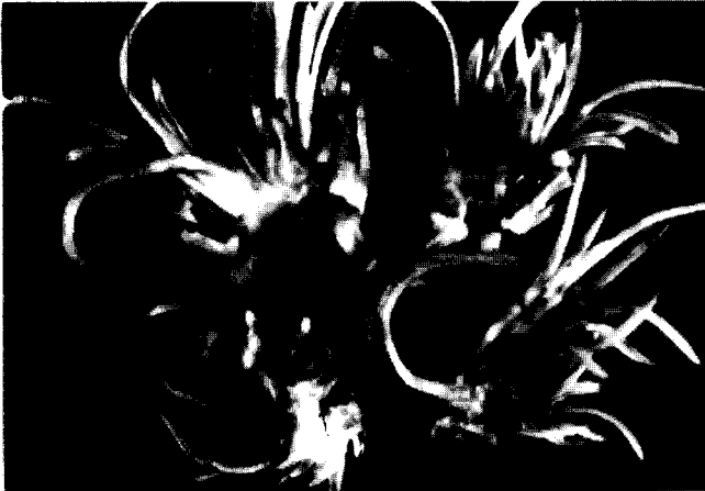
Figure 2. Bulb clusters with swollen basal plate produced in ebb & flood type bioreactors.

터 자구형성을 위해 명, 암으로 구분하여 배양한 결과, 절편체당 자구수는 암배양보다 명배양이 약간 많았으나 절편체당 형성된 총자구무게는 거의 차이가 없었다. 그러나 인편엽의 생육은 명배양에서 월등히 촉진되었다. 생장조절제는 BA 2.0 mg/L와 IAA 0.3 mg/L의 혼용 처리구에서 자구수 및 절편체당 총자구무게가 높아 저반부가 비대된 자구의 증식이 양호하였다 (Table 1). 나리에서 부정아 형성시 광의 영향에 대하여는 서로 상반된 결과가 보고되었다. Han 등 (1999a)은 L. Oriental Hybrid 'Casa Blanca' 배양에서 저반부가 비대된 자구 절편체에서 자구의 재생은 명배양에서 촉진되었다고 하였으며, Niimi (1984a)도 L. rubellum 의 배양에서 암배양보다 명배양에서 생체중 및 부정자구의 형성이 더 우수하였다고 보고한 반면, Stimart와 Ascher (1978)는 L. longiflorum 에서,