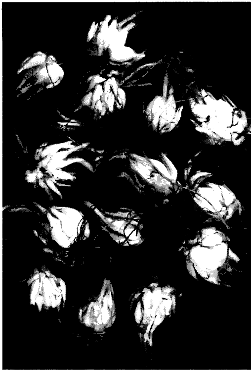
Figure 4. Bulblets produced in airlift bioreactors.