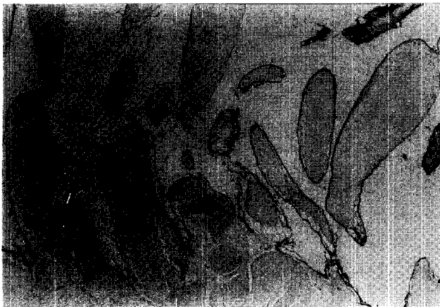
Fig. 3. Pathology(H/E stain) : multiple vascular papillary fronds lined by a single layer of endothelium