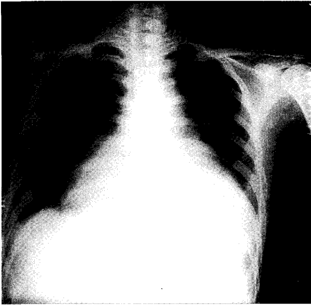
Fig. 1. Preoperative Chest X-Ray : Cardiomegaly and pulmonary edema

구출율 46%, 승모판막과 대동맥판막의 비후 및 석회화가 관찰되었고, 중증 승모판막 협착증, 중증 대동맥판막 폐쇄부전 및 중증도의 대동맥판막 협착증 소견이 보였으며, 좌심실내 심중격에 줄기가 부착된 3.5×1.8 cm 크기의 종괴와 승모판막에 부착된 1.5×1.5 cm 크기의 종괴가 관찰되었다(Fig. 2). 내원 당시 시행한 심전도상 심방세동 소견을 보였으며 심박동수는 160/min으로 관찰되었다. 내원 당시 동맥혈 검사에서 산소를 흡입하지 않은 상태에서 pH 7.443, PaO 2 121.4 mmHg, PaCO 2 10.0 mmHg, BE 6.9, O 2 saturation 98.7%이었다. 환자는 울혈성 심부전(NYHA class IV), 승모판막 협착증, 대동맥 판막 협착증 및 폐쇄부전, 감염성 심내막염 의심하에 심혈관계 집중치료실로 입원하였다. 입원 후 digitalization, 항응고제 치료(heparin), 이노제, 항생제 치료를 시작하면서 주의 깊은 생명징후 관찰을 시행하였다. 내원 3일째 심박동수 120/min으로 감소되고 생명징후 안정화되어 일반병실로 이실하였다. 환자에게 수술 권유하였으나 환자 거부하고 대증적 치료 및 내과적, 보존적 치료하던 중 내원 16일째 다시 호흡곤란증세 심해지고 장기간에 걸친 식사 부족으로 인한 전신 쇠약 증세 심해져서 심혈관계 중환자실로 이실하였다. 이실 후 비강으로 산소 5L 흡입하면서 시행한 동맥혈 검사 상 pH 7.49, PaO 2 135.4 mmHg, PaCO 2 16.0 mmHg, BE -7.7, O 2 saturation 99%이었으며 호흡수는 30/min으로 관찰되었다. 오전 10:45부터 11:15까지 4차례의 심실 빈맥을 보여 디곡신 독성, 일시적 심허혈, 전해질 불균형 의심 하에 혈액검사 시행하면서 경흉 초음파 시행하였으나 입원당시와 큰 차이는 보이지 않았다.