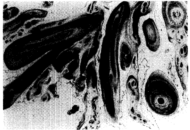
Fig. 4. Pathology(Elastin Stain) : multiple fronds composed of acellular collagen with irregular clumping of fragmented elastin fibrils along the surface

하였다. 술후 시행한 경흉 초음파에서 인공판막의 기능은 잘 유지됨이 관찰되었다. 병리검사(Fig. 3, Fig. 4)상 판막주위의 종괴들은 유두상 섬유 탄력증임 밝혀졌다. 환자 일반병실 이실 후 장기간에 걸친 운동부족으로 인한 근육 수축현상과 식사불량으로 인한 전신 쇠약감 및 저단백증, 전해질 불균형 등을 보였다. 수술로 인한 합병증의 가능성을 배제한 후 술 후 17일째 내과적 치료 위해 내과로 전과되었다. 전과후 정기적인 혈액검사와 재활치료를 통한 전신 보존적 치료후 술 후 61일만에 양호한 상태로 퇴원하였으며 현재 외래 추적중이다.