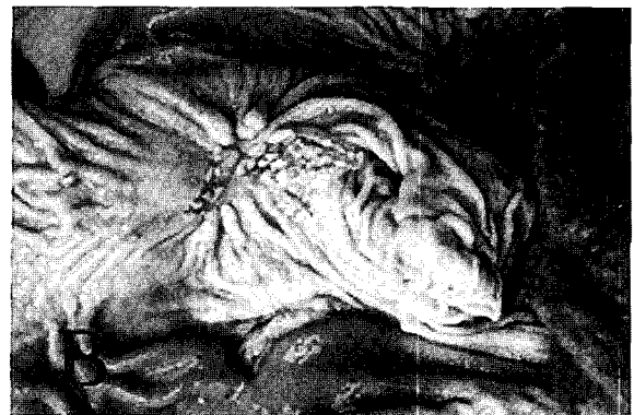
Fig. B. Keratinization of par esophagus.