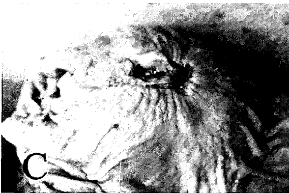
Fig. C. Ulcer accompanying keratinization