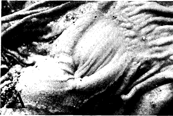
Fig. A. Normal appearance of par esophagus.