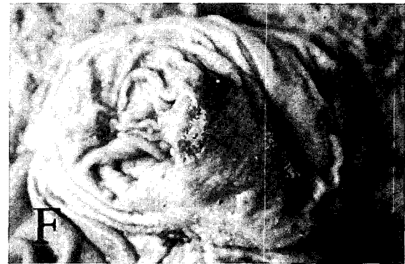
Fig. F. Congestion of pylorus.