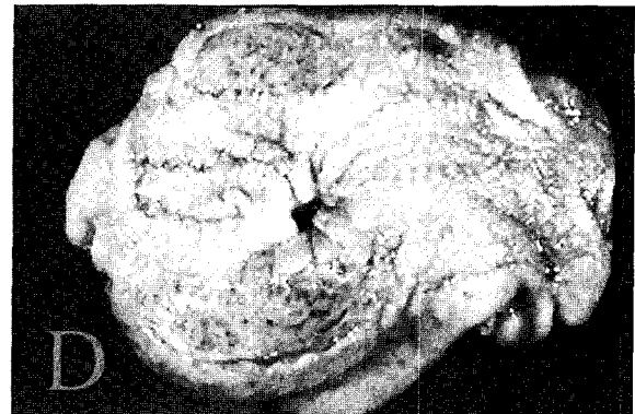
Fig. D. Scar tissue was formed in the ulcerated lesions.