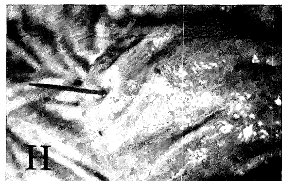
Fig. H. Pierce wound by a toothpick.