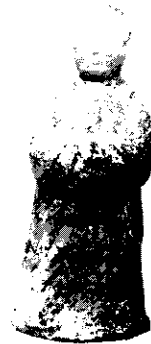
[그림 1] 채색 인물도용의 여인상

고려시대(935~1392)는 전시대를 통하여 저고리의 깃이 목관깃에 중저형(重褶形)으로 변하여 옆에서 작은 고름이나 매듭으로 여몄다. 대체로 이색선(異色線)이 없고 치마 허리끈을 앞으로 길게 늘어 뜨렸