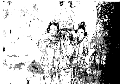
[그림 2] 밀양 고법리벽화 인물복식

1910년 한일합방 때도 한복의 개량화는 계속되어 여학교의 교복착용 등 실효를 거두었다. 그후 8.15 해방과 5.16 군사혁명 이후까지 이어졌으나, 1960년