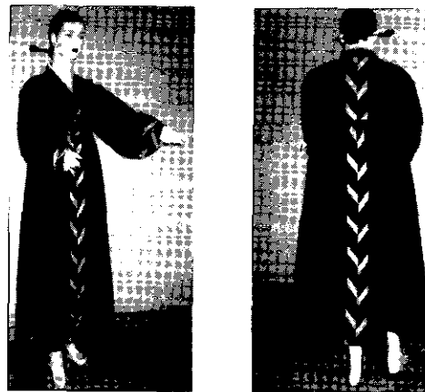
[그림 4] 동그레깃 저고리와 조끼치마(앞/뒤)