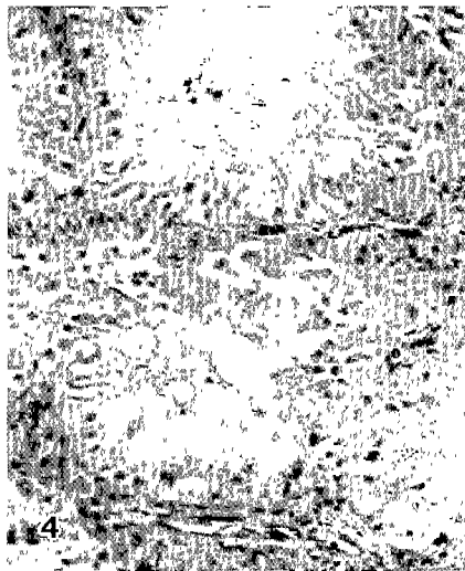
Fig 4. Pet Iguana, testis. Severe atrophy of seminiferous tubules is noticed (H&E, × 240).