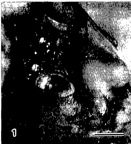
Fig 1. Pet Iguana, skin. A subcutaneous mass is seen in the skin (Bar = 1 cm).

서 산발적으로 관찰되었는데, 피막의 외측에서는 응집소를 형성하고 있기도 하였다(Fig 3). 종류의 피막과 진피 사이의 결합조직에는 소형의 림프구 및 위호산구가 경도로 침윤되어 있었으며, 특히 혈관주위에서 집락소를 형성하고 있었다. 종류 바로 윗부분의 진피에서는 약간의 각질화가 관찰되었다. 그람 염색의 결과 종류의 내부 및 피막에서는 어떠한 세균도 관찰되지 않았으나, 오직 진피의 각질화된 부위에서만 그람 음성 혹은 양성의 구균괴가 관찰되었다. 원충의 감염 여부를 검사하기 위한 PAS 염색에서는 양성반응을 보이는 어떠한 원충도 진피, 상피하 조직 그리고 종류의 피막과 내