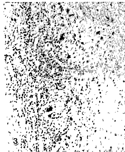
Fig 3. Pet Iguana, skin. Lymphoid cell aggregate and scattered heterophils, macrophages and lymphocytes are seen in the fibrous connective tissue surrounding necrotic mass (H&E, × 240).