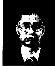
서 대 화

1985년 부산대학교 계산통계학과(이학사) 1989년 부산대학교 대학원 전자계산학과(이학석사) 1998년 부산대학교 대학원 전자계산학과(이학박사) 1989년-1996년 한국전자통신연구원 연구원 1996년-현재 신라대학교 컴퓨터교육과 조교수 관심분야: 운영체제, 멀티미디어, 병렬/분산시스템, 컴 퓨터교육 e-mail : yulho@silla.ac.kr