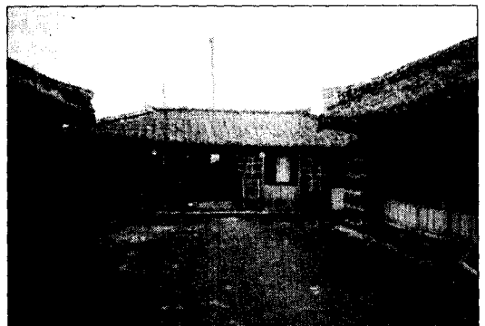
사진 1. 제주도 와가 (H가옥)

가옥의 건립당시 거주인을 살펴보면 <표 2>와 같이 고용인이 반드시 있었고, 이들은 모거리나 이문거리에 기거하는 경우가 많았다. H가옥의 경우는 함께 기거하지는 않았으나, 정기적 혹은