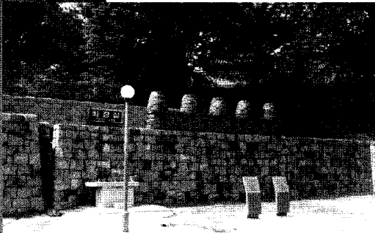
▲ 진주성 야외공연장 화장실

다른 지자체와 차이있는 특색 사업들은 청결 활동을 기본으로 특별관리 기간을 정하여 사용자 수에 따른 청소 횟수 조정으로 상시 청결 유지를 하고 국도 14호선(마산-거제)등을 시범거리로 지정하여 상대적으로 부족한 국도, 지방도 등 공중화장실 현대화 계획을 추진 중에 있으며 각 시·군의 추진 상황을 매월 5일까지 도에 제출 받고 있습니다. 특히 불특정 집회 또는 행사에 절대적으로 부족한 공중화장실 문제의 해결을 위해 참여 예정인원을 사전에 파악하여 임차 또는 자체보유 화장실을 지원하고 있으며 교육청과 협의하여 학교 화장실 환경 개선 사업과 올바른 사용 습관을 키우기 위해 청결 사용 운동도 적극 추진하고 있습니다.