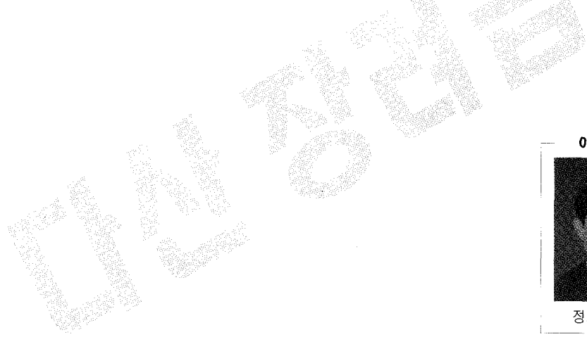
이 증 현