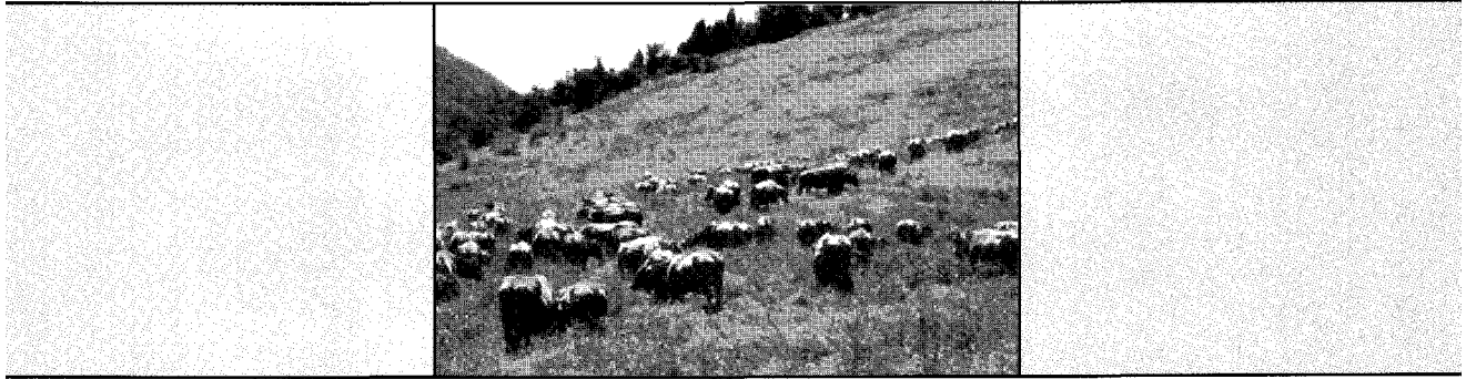
[표 2] 종모우별 근친종모우 내역