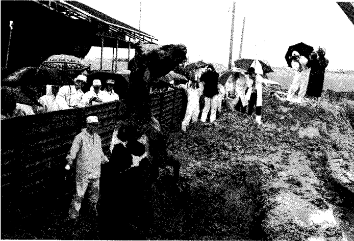
▲구제역 발생축의 살처분 및 매몰 모습 (CPX훈련)

○국제수역사무국(OIE) 및 관련국에 구제역 발생 통보 및 국제표준연구소에 검사요청