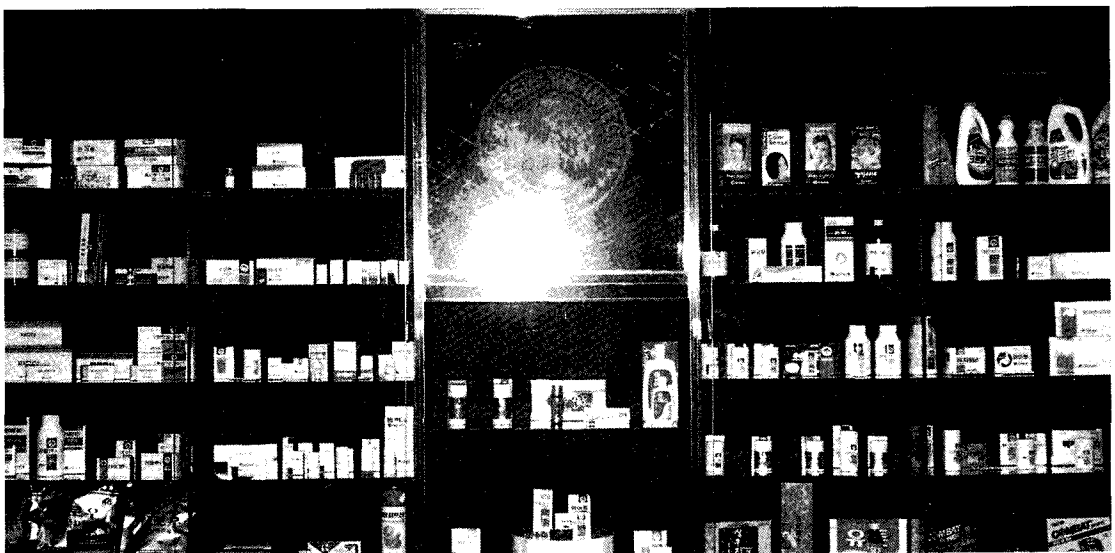
▲ 유한양행 약품 포장