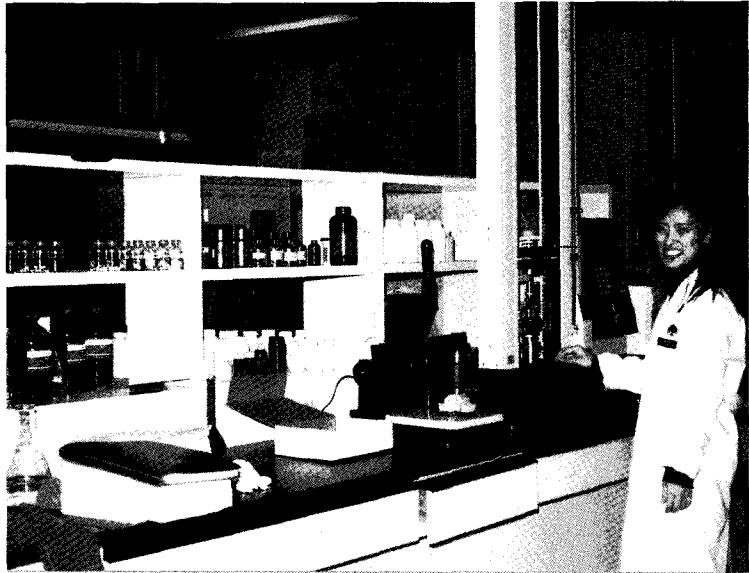
▶ 유한양행 품질 관리실

다양한 재질과 규격을 통일하고자 3년여의 연구 끝에 L 시리즈 용기를 만들어 플라스틱 용기 포장의 공용화에 성공한 바 있다.