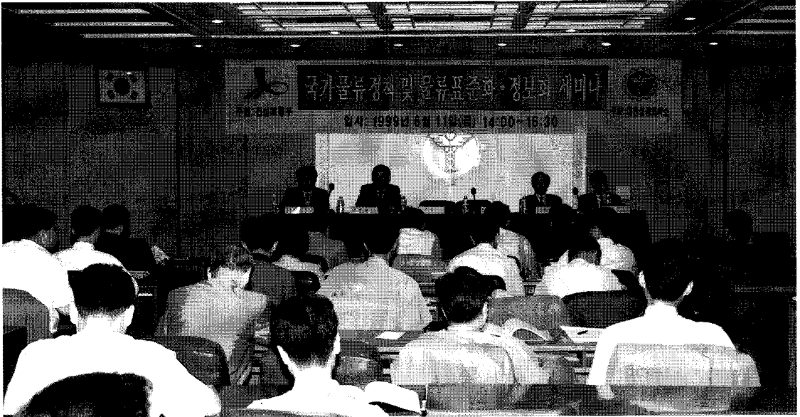
▲ 제 1회 민관합동 물류표준화설명회

1995년 유니트로드시스템 통칙을 제정하여 표준파렛트 보급확산에 나서게 되었다. 그러나 물류표준화의 척도라고 할 수 있는 표준파렛트의 보급률이 아직 17%(1997년 현재) 수준에 머물러 있어 물류효율화의 길은 멀기만 하다.