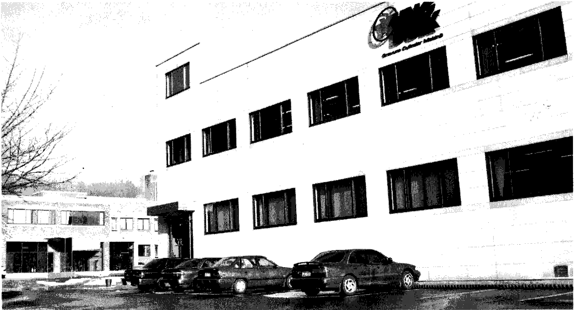
▲ 경기도 안산에 위치한 (주)용덕디앤시 전경

무이사는 “이처럼 안정적인 시스템을 통해 재출고시에도 품질의 안정성을 극대화할 수 있어 고객들로부터 만족적인 평가를 받고 있습니다”라고 설명하는 한편, 인쇄관리 데이터의 구축을 통해 유저들이 교정작업을 할 때나 인쇄를 할 때 불가동 시간을 단축할 수 있는 장점을 덧붙여 설명하기도 했다. 또한 사전 컨폼제도와 데이터화된 시스템 안에서 작업을 하게 되므로 조각 후 30분 이내에 작업을 시작할 수 있어 시간적인 효율화를 꾀할 수 있고, 데이터화로 인한 정확한 제품 생산이 가능하게 됐다.