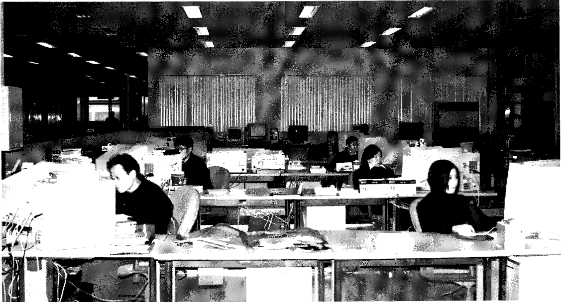
▲ (주)용덕디앤시는 전사적인 컴퓨터시스템을 구축해 효율적인 운영에 박차를 가하고 있다.

“직원 한사람 한사람에 대한 투자가 궁극적으로 는 기업의 힘을 키우는 토대”라면서 앞으로 (주) 용덕디앤시를 프로화된 전문가 집단으로 성장시키겠다는 강한 의지를 보이기도 했다.