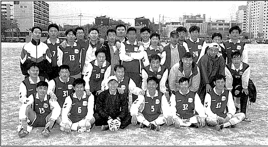
대회 우승팀인 동그라미호 회원들.

미는 등 경기장은 순식간에 난장판으로 변해 버렸다. 선수단 일동이 예선전부터 보여 주었던 페어플레이와 친목의 분위기를 한꺼번에 무너뜨리는 실망스러운 모습이었다.