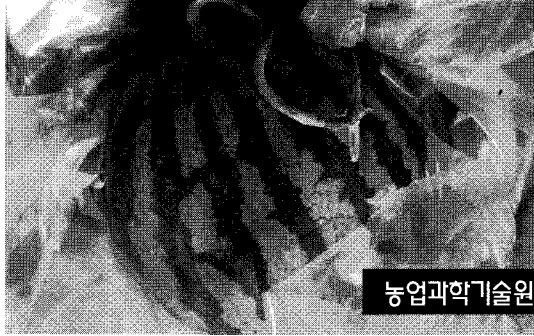
농업과학기술원 식물보호부 식물병리과