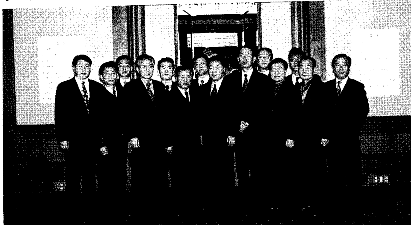
정기총회가 끝난후 회원사 대표들이 함께 포즈를 취했다.

올해부터 ESCO협회는 에너지절약기기의 공동구매 시범사업을 펼치기로 했다.