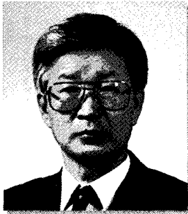
롯데알미늄(주) 대표 고 충 준 비철금속압연및압출업 금천구 독산동 1005