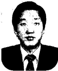
글 / 임 현 석 세무사

2000년 7월 1일부터 소규모사업자에 대한 부가가치세 과세제도가 이렇게 바뀝니다.