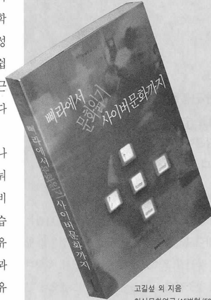
고길술의 저음 현실문화연구/A5변형/520면/15,000원

이 책은 90년대 후반 이후 문화에 관한 글쓰기의 성과들을 묶고 있다. 좀더 정확히 말한다면 95년 봄부터 2000년 봄 사이에 씌어진 글들이다. 말하자면 이 책은 90년대 후반기 문화비평의 주요성과들을 망라한 엔솔로지인 셈이며 그런 의미에서 같은 출판사에서 93년 말에 나온 《문화연구 어떻게 할 것인가》의 연장선상에서 있다.