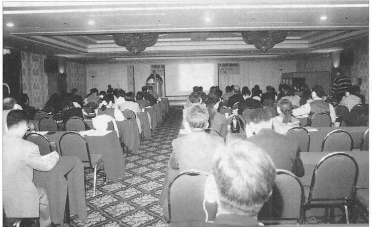
지난 달 25일부터 3일 동안 세종호텔에서 열린 <저작권 국제 세미나>의 한 장면. 디지털 콘텐츠 저작물의 저작권 보호와 관리에 대해 집중적으로 토론했다.

한국간행물윤리위원회(위원장 윤양중)는 지난달 31일 세종문화회관 세종홀에서 <제11회 간행물윤리상 시상식>을 열었다. 각 부문별 수상자 명단은 다음과 같다. ▲윤리대상 : 범우사 윤행두 대표 ▲저작 부문 : 성신여자대학교 전상운 전총장 ▲출판제작 부문 : 도서출판 학교재 우찬규 대표,