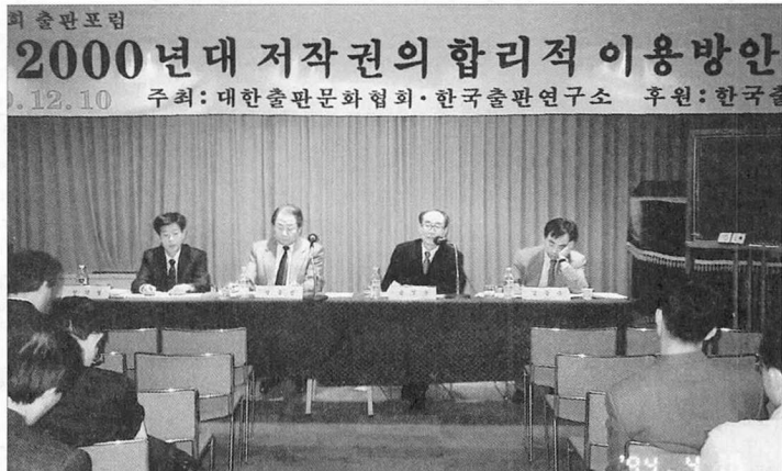
제18회 출판포럼 장면

용' 항목을 신설했다. 프로그램심의조정위원회 신각철 연구위원은 "전자출판물은 디지털 정보로서 컴퓨터 통신망에 의한 복제·전송이 용이하다. 우선 도서관 등에서 아무런 경제적 부담과 노력 없이 출판사에서 제작한 전자출판물을 그대로 복제·전송할 수 있다"고 밝혔다.