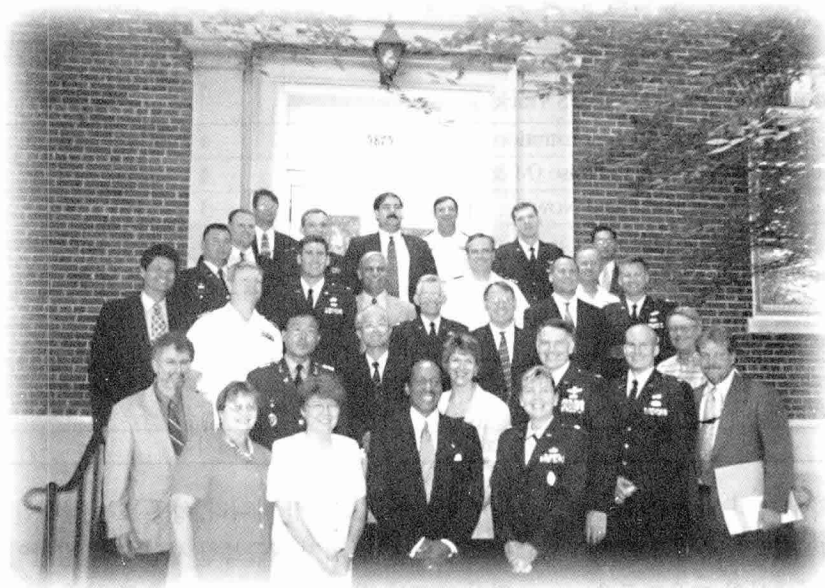
같은반 급우들과 함께한 자리

업예산 심의, 로비활동 등에 대한 설명을 듣고, 상원 분과 위원회 회의의 참관, 국회 도서관 답사 등에 하루 를 할당하였고, 레이더 및 전자전 장비를 생산하는 Northrop Grumman사의 Systems & Technology Division 및 해병대용 신형 상륙돌격 장갑차 (AAAV)를 체계 개발중인 General Dynamics사의 Land Systems도 방문하여 방산 물자 및 업체의 실 태를 파악하고 토의하는 기회를 가졌다.