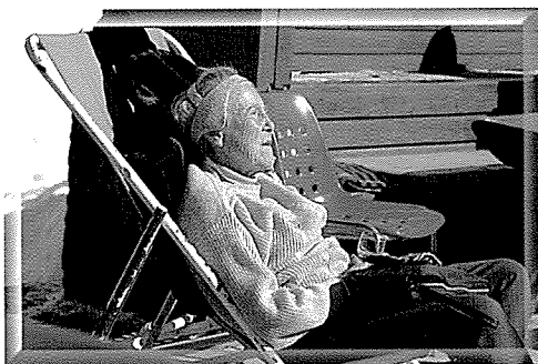
▲ 일광욕을 즐기는 스위스 노인. 여성들의 평균 연령은 85세 이상이며 100세를 넘는 노인들도 상당히 많다.