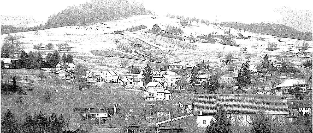
▲ 맑은 물과 공기로 인해 유난히 장수촌이 많은 스위스 알프스의 산촌