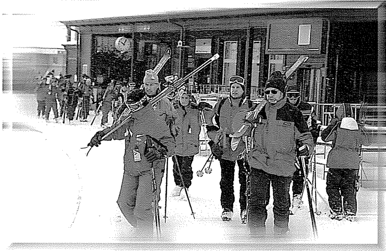
▲ 스키가 생활화된 스위스에선 노인들도 젊은이와 어울려 스키를 타면서 건강을 지킨다.

지난 1세기 동안 스위스에선 100세를 넘는 노령 인구가 급증하는 추세에 있다. 생활 환경의 개선과 의료 수준이 과거에 비해 월등히 높아진 결과이다. 또한 알프스 같은 고산지