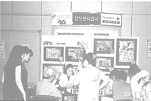
▲ 대구지부는 관내 학생들 중 증식지원학생에 대한 건강검사를 실시했다. 이번 검사는 관내 교육기관의 협조를 얻어 초등학생 34명, 중학생 11명, 고등학생 8명 등 53명과 생활이 어려운 지역주민 32명에게 실시되었다.