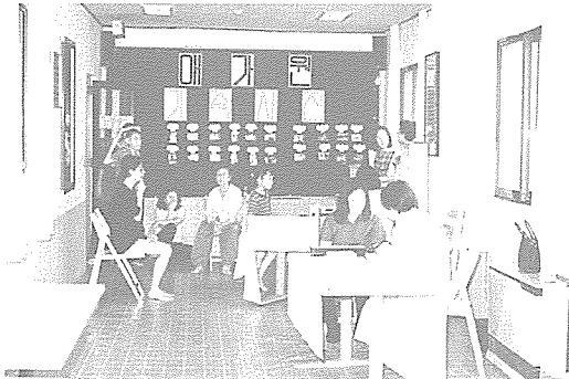
▲ 경북지부는 시 사회복지과의 협조를 얻어 경주에 있는 복지시설 수용자 보호소인 애가원 및 대자원을 방문하여 원생 69명에게 기초검사, 심전도, CBC, B형 간염검사 등을 실시했다.