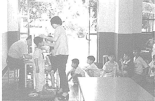
▲ 전남지부는 정신지체아 학교인 광주 은혜학교 학생 82명, 나주시 장애인 복지관, 완도군 장애인 복지관 원생 110명 등 총 192명에게 무료건강검진을 실시했다.