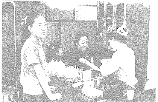
▲ 울산지부는 중구관내 사회복지회관의 협조를 얻어 생활보호대상 학생, 일반인과 증식지원학생 등, 양정초등학교 외 4개교 학생들에게 무료 건강검진을 실시했다.