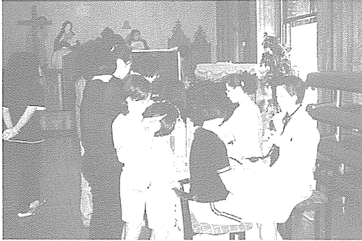
▲ 전북지부는 시 사회복지과와 관내 교육기관의 협조를 얻어 삼성보육원, 사랑의 집, 지역주민 등 517명과 무주초등학교 외 15개 초·중학교 중식지원학생 105명에게 무료검진 실시했다.