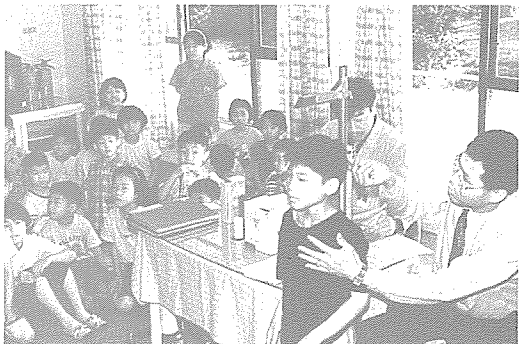
▲ 강원지부는 생활보호대상 학생과 복지시설인 오순절보육원, 애민보육원 어린이 등을 대상으로 무료 건강검진을 실시했다.