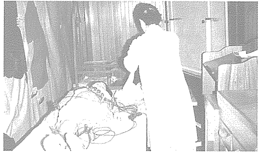
▲ 인천지부는 지난 5월 10일~23일까지 인천관내의 신명보육원, 인천보육원, 향지원, 소망의 집을 방문하여 225명 전원에게 무료 건강검진을 실시했다.

앞으로의 무료환원사업 일정은 각 시·도 사회복지과, 기관·단체 등의 협조를 얻어 재활원, 오지지역주민, 환경 오염지역, 양로원, 장애인시설 등에서 실시할 예정이다