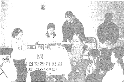
▲ 부산지부는 육아시설인 매실보육원, 미애원, 종덕원 등을 방문하여 100여명에게 무료 검진을 실시했다.