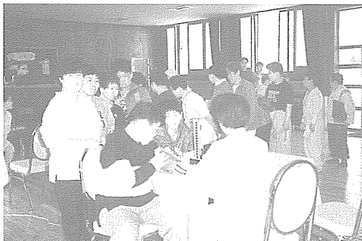
▲ 충남지부는 한마음요양원 등을 방문하여 160여명에게 기초검사, 혈액질화염사, 간기능검사 등 11개종목 25항목에 대해 무료 건강검진을 실시했다.