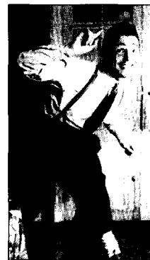
(그림 6) 남자 Zazous