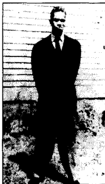
(그림 2) 주트 슈트 입은 말콤 X