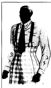
(그림 4) 주트 재킷을 벗은 모습