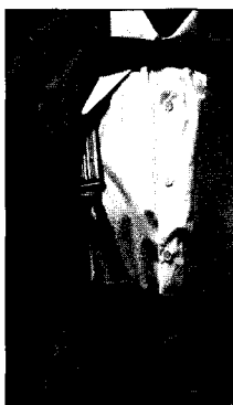
(그림 5) Calloway의 주트 슈트