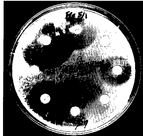
Fig 2. Antimicrobial susceptibility test against Clostridium perfringens

(10 IU), tetracycline(30 µg), trimethoprim/sulfamethoxazole(1.25 µg/23.75 µg) 등의 항생제 디스크를 떨어 뜨리고, 37°C에서 48시간 동안 Steel wool method에 의한 혐기배양을 실시하였다. 배양 후 저해환(inhibition zone)의 지름(mm)을 측정하여 항생제 디스크의 판정기준표와 비교하고, Resistant, Intermediate, Sensitive로 구분하여 항생제 감수성을 판정하였다.