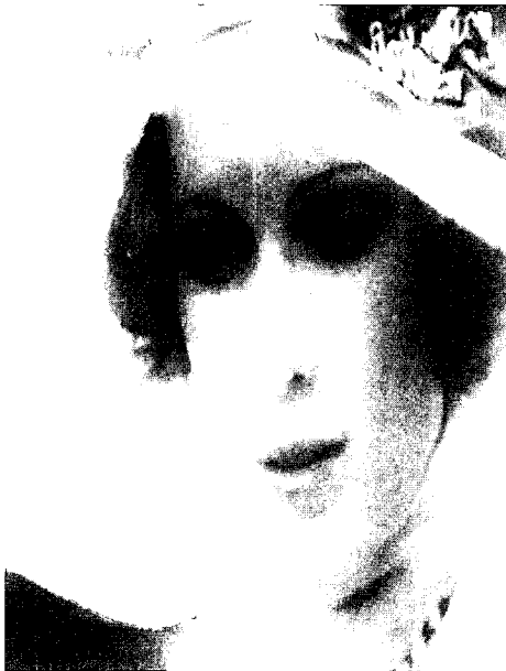
Fig. 4. Daisy in the Movie 'The Great Gatsby'

“나는 베이커 양을 보면서 그녀가 한 일이 무엇일까 생각했다. 그녀는 날씬하고 젓가슴이 작은 여자로서 몸가짐