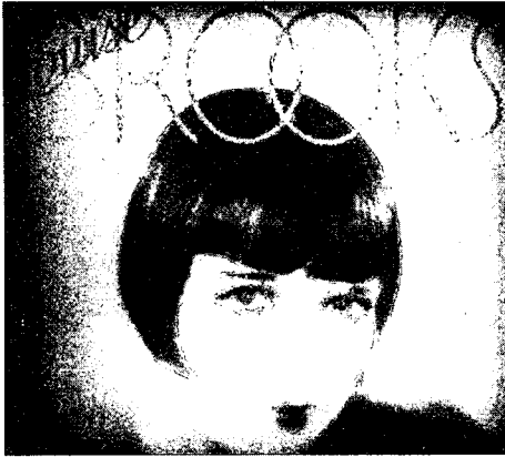
Fig. 8. Famous flapper, Brook's Hair style and make-up

다"로 시작하는 첫 문장에서부터 플래퍼들의 특성과 그들의 행동과 외모가 잘못된 것이 아니라 새로운 유행을 향해서 기성세대들이 간직한 전통을 거부하고 자하는 하나의 표현이라는 점을 강조하고 있다. 그리고 거부의 몸짓이 모두 확신했던 것이 아니라 외모와 행동 그리고 의식의 강도에 따라 semi-flapper, flapper, superflapper로 구분 짓고 있다 29) . 이는 기존의 관습과 전통이 여성들에게 요구했던 여성스러운 아름다움에 저항한 여성 주체로의 새로운 미의 탄생을 보여주었고 이러한 자신을 위한 원칙을 기본으로 하는 현대주의의 표현이었다. 플래퍼란 현대(flapper is modern) 30) 라고 지적되었던 것처럼 그들의 이미지는 새로운 모더니즘의 표현이라 할 수 있다.