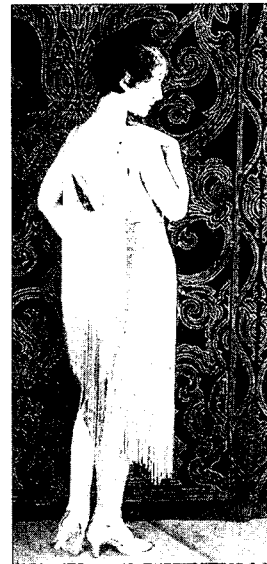
Fig. 9. Beaded dress, New York Fashion, p. 81

즉 시대상황을 단적으로 표현하고 있는 재즈라는 말이 공통된 문화언어로 볼 때 이것이 패션에도 그대로 전달되어 나타난 것이며 이 나타내는 행위의 주인공이 바로 플래퍼라 할 수 있다.