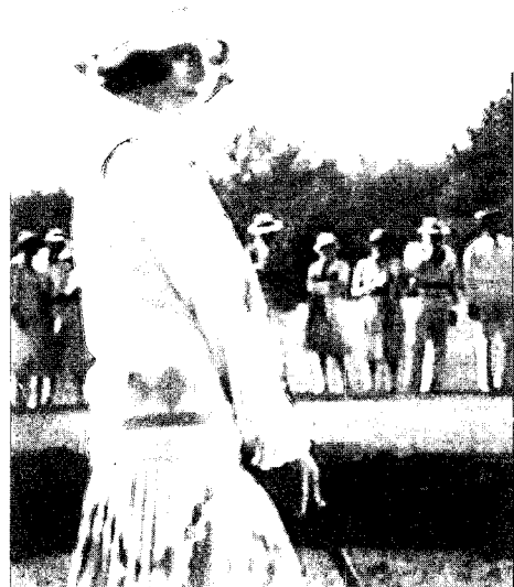
Fig. 5. Baker in the Movie 'The Great Gatsby'

결국 스피러(R. E. Spiller)의 지적처럼 미국 문명을 건설한 근원적인 원동력이 이상주의와 물질주의라면 27) 이러한 사상이 재즈시대 플래퍼들에게서는 미국적 청교도 이상주의가 지극히 현실주의로 변했