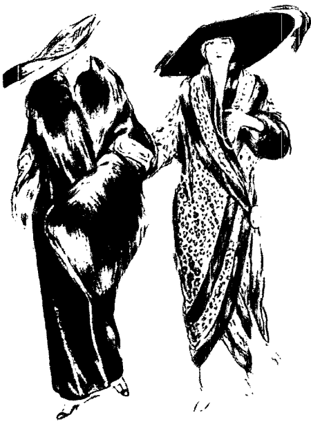
Fig. 6. Big hats, hobble skirts and Grand Dame Image, The Historical Mode , p. 20.

1922년 12월 6일자 Outlook 에 실린 기사 'A Flapper's Appeal To Parents'의 내용을 보면 그들의 저항적 사고에 대해 기성세대들의 이해를 구하고 있다. "의모로 판단할때 나는 플래퍼로 간주되