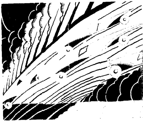
Fig. 3. Headscarf, Automobiles, speed and modernity all collide in this most modern of headscarves, '20s and '30s Style, p.93.

어'에서 '동작'과 '몸짓'으로 옮겨짐에 따라 20세기 사람들의 감정적 생활이 이전과 달라져 이제 시각적으로 변해 가고 있다고 지적하였다. 그리고 현대 문화는 이전의 예술가들을 지배하고 있던 추상적 정신을 눈으로 볼 수 있는 육체로 전환시키고 있는 듯하여 결국 영화라는 매체는 현저한 시각 지향(Visual Orientation)을 초래했음에 틀림없다고 주장했다 19) . 모든 것을 확실하게 사실로 표현하려는 '현실주의'에 근거를 두게 되어 눈에 보이지 않고 귀에 들리지 않는 것은 중요하지 않았고 시각화, 청각화