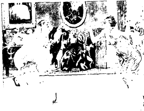
Fig. 2. "Le Black Bottom", The dance was introduced into Europe from the United States, Fashion of a Decade: 1920, p. 18