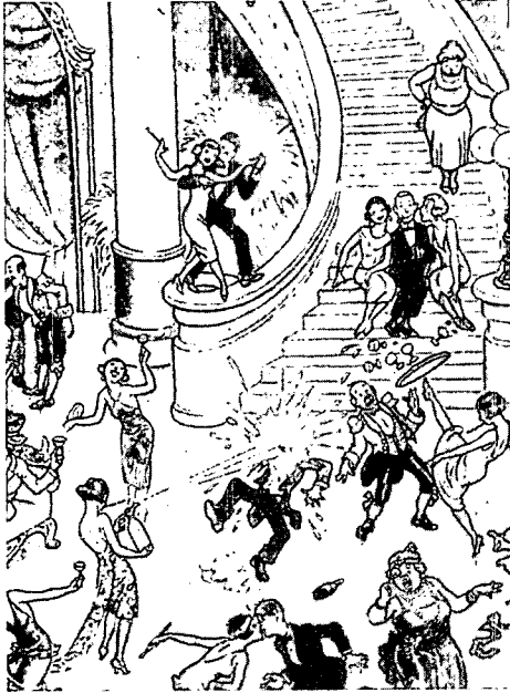
Fig. 1. Cartoon by R.B. Fuller picturing a wild 1920s party, Fashion of the Roaring 20s, p. 7

재즈시대 이전에는 남성과 함께 술을 마신다는 것은 상상 할 수 없었던 여성들이 남성과 함께 술 시합을 하며 시끄럽게 떠들면서 해방을 즐겼다(Fig. 1).