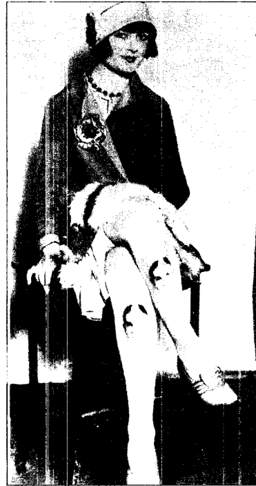
Fig. 11. Society girl with a portrait of her boyfriend printed onto her stockings, Fashion of a Decade: 1920, p. 29

새로운 제즈시대의 패션은 플래퍼들을 타겟으로 하여 길고 가는 다리의 노출, 어린소녀풍의 미성숙된 몸 그리고 팔과 등의 노출 등은 바로 젊은 세대들이 누릴 수 있는 특권이었고 젊고 어린 이미지를 보이려는 목적에 있었다(Fig. 11) 37) . 보그에서도 '우리는 스마트하게 되고 싶다. 그러나 어려운 것이 아니다. 하나의 실루엣 젊은 실루엣이 있다.' 38) 라고 지적