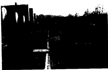
(복원 전; 1996)

국내에서는 1980년대 말부터 하천 기술자들 사이에 하천 환경의 보전과 개선의 필요성에 대한 공감대가 서서히 형성되기 시작하였다. 이러한 변화는 그 당시 경제 개발의 진전과 국민 생활의 향상에 따라 이제는 주변을 돌아볼 필요가 있다는 환경 보전에 대한 사회적 분위기에 의한 것이다. 특히 토목 재료를 이용하여 하천을 획일적으로 인공화 하는 치수 사업에 대해 가능한 생물 재료를 이용하여 하천을 자연에 가깝게 정비하는 이른바 자연형 하천공법의 도입에 대한 공감대가 형성되기 시작하였다. 이에 따라 1990년대 들어 자연형 하천 계획과 공법에 대한 연구가 본격적으로 시작되고(건교부/건기연, 1991~1996), 양재천, 오산천 등 일부 하천에 실제 적용되었다. 1990년대 중반에는 하천 복원 측면에서 생태, 조경 전문가들에 의해 자연 상태에 가까운 하천 구간을 대상으로 하천 생태계 구조와 기능에 대한 지속적인 연구도 병행되었다(환경부/건기연, 1997~1999).