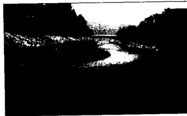
(복원사업 직후; 1997)