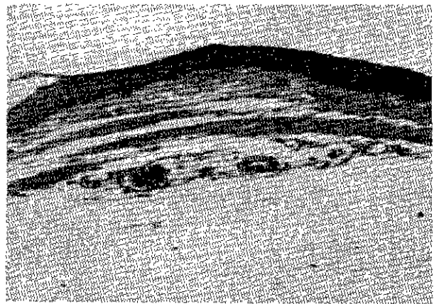
Fig. 3. Histopathological lesion of oral mucosa of cheek pouch in hamster which was implanted with hydroxyapatite sinter for 14 days (H & E stain, \times 4 ).

투여부위에서는 나타나지 않은 것으로 보아 레진 처리에 의한 반응은 아닌 것으로 판단되었다.