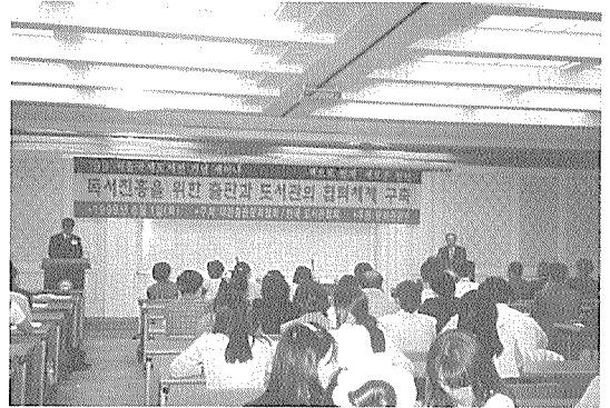
〈'99년 6월 1일 COEX에서 개최된 서울국제도서전 기념세미나 광경〉

우리 협회는 대한출판문화협회와 공동으로 "'99 서울국제도서전(99. 6. 1. 6., 한국종합전시장 태평양관) 기간 중 첫날인 6월 1일 <전문인의 날>에 "독서진흥을 위한 출판과 도서관의 협력체제 구축"이라는 주제를 가지고 세미나를 개최하였다.