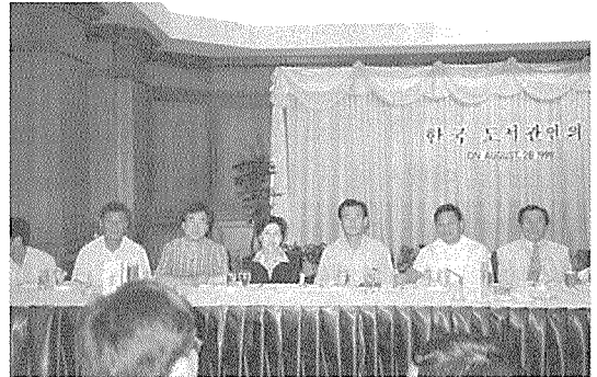
〈 한국 도서관인의 밤 ” 행사모습, 우측에서 세번째가 필자 〉

내일 폐회식때 2006년 IFLA 총회유치 발표가 있을 때 힘차게 환호할 것을 서로 약속하면서 화기에 넘치는 모임을 마쳤다.