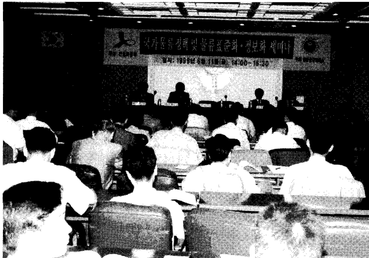
▲ 물류 표준화 설명회(서울상공회의소 6/11)