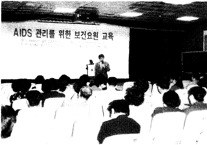
본회 서울특별시회는 4월 22일 서울특별시학교 보건원 강당에서 〈AIDS관리를 위한 보건요원 교

육〉을 실시했다. 서울특별시의 후원으로 열린 이번 교육에는 각 보건소 에이즈담당계와 검사요원 50여명이 참가하였다.