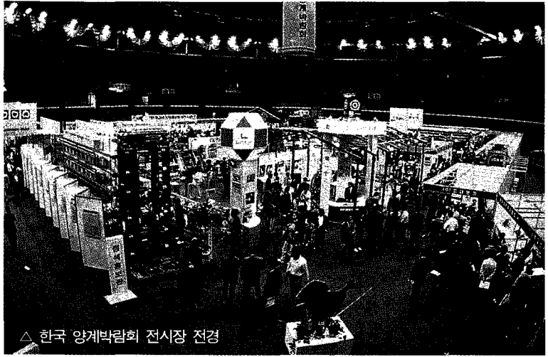
△ 한국 양계박람회 전시장 전경

다행히 축산박람회는 전 축산인들의 지대한 관심과 협조에 힘입어 대체적으로 순조롭게 준비가 되어가고 있습니다. 우선 축산박람회 개최 초년도인 금년에는 그간 한국양계박람회를 4회 째 개최한 경험이 있는 대한양계협회가 4개 공동 주체 단체인 한국낙농육우협회, 대한양돈협회, 한국축산