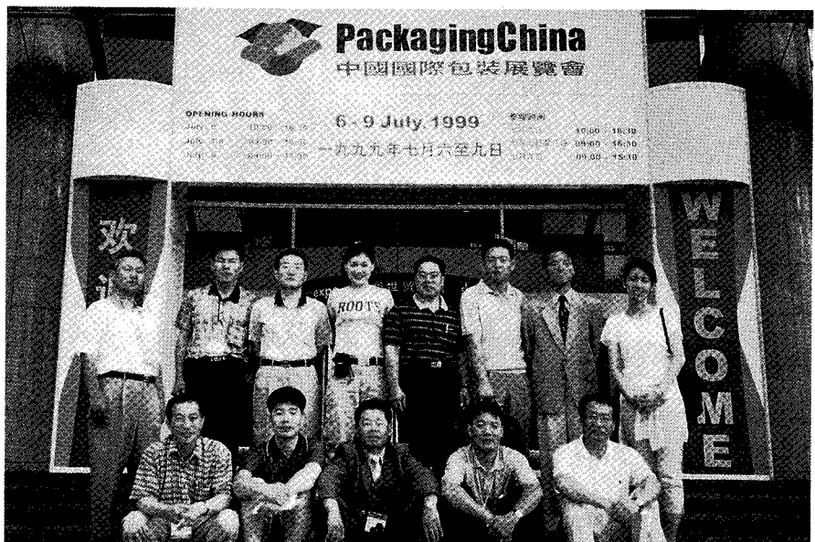
▶ 패키징차이나를 참관한 한국포장기계협회 일행이 전시장 앞에서 기념 촬영에 임했다.

중국에는 여러 개의 포장기자재전이 있지만 가장 조직적이고 알찬 전시회로 판단되어 우리 한국포장기계협회가 국제적인 차원에서