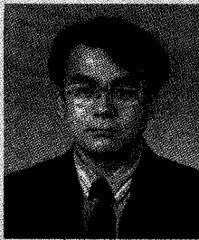
김 세 농

포장산업 업종의 관리조직으로의 중국포장기술협회도 포장사업의 심화와 발전에 따라 크게 장대해졌는데 현재 6천여개의 회원사와 25개의 전문위원회(분회, 연합회), 46개성, 자치구, 직할시, 중심도시 등에 지방포장기술협회 산하 조직을 가지고 있으며 자문, 전람, 교류, 정보, 신문, 출판등의 사업을 수행하고 있다.