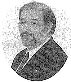
패셔라키 < FACTs 사장 >

본 자료는 지난 10월 22일 한국석유공사에서 패셔라키 박사가 강연한 「국제석유시황 설명회」의 내용중 발췌·편집한 것이다. <편집자주>