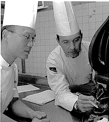
'99 월드 빠띠세리에 참가하는 한국팀의 매니저를 맡고 있는 그는 한국 방문 기간중 대표 선수들에게 직접 기술을 지도하기도 했다.

제품을 만드는 기술인들이 자신의 일에 대한 철학을 가져야 한다고 강조한다. 제품 하나 하나에 만드는 사람의 혼과 정신이 담겨 있어야 한다는 것이다.